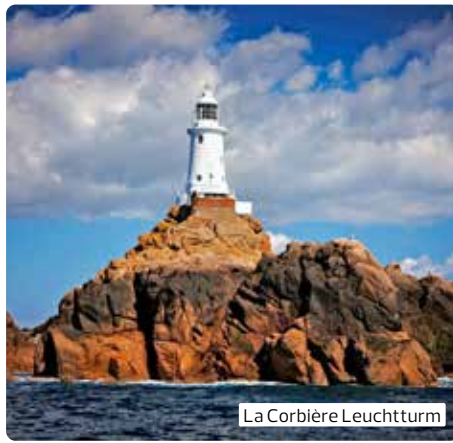
La Corbière Leuchtturm