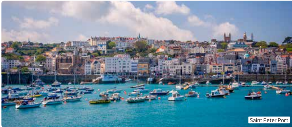
Saint Peter Port